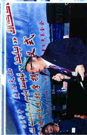
海鸥助学 爱洒天山